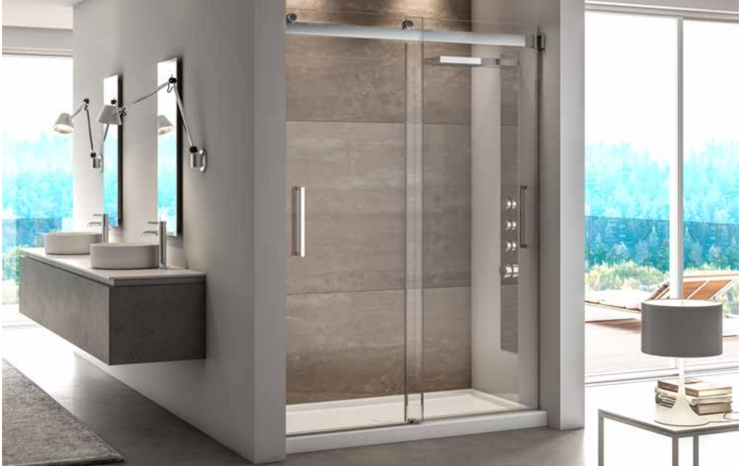
Model shown / Modèle présenté : NMS160-11-40R-79

Bypass sliding doors / Portes coulissantes bidirectionnelles